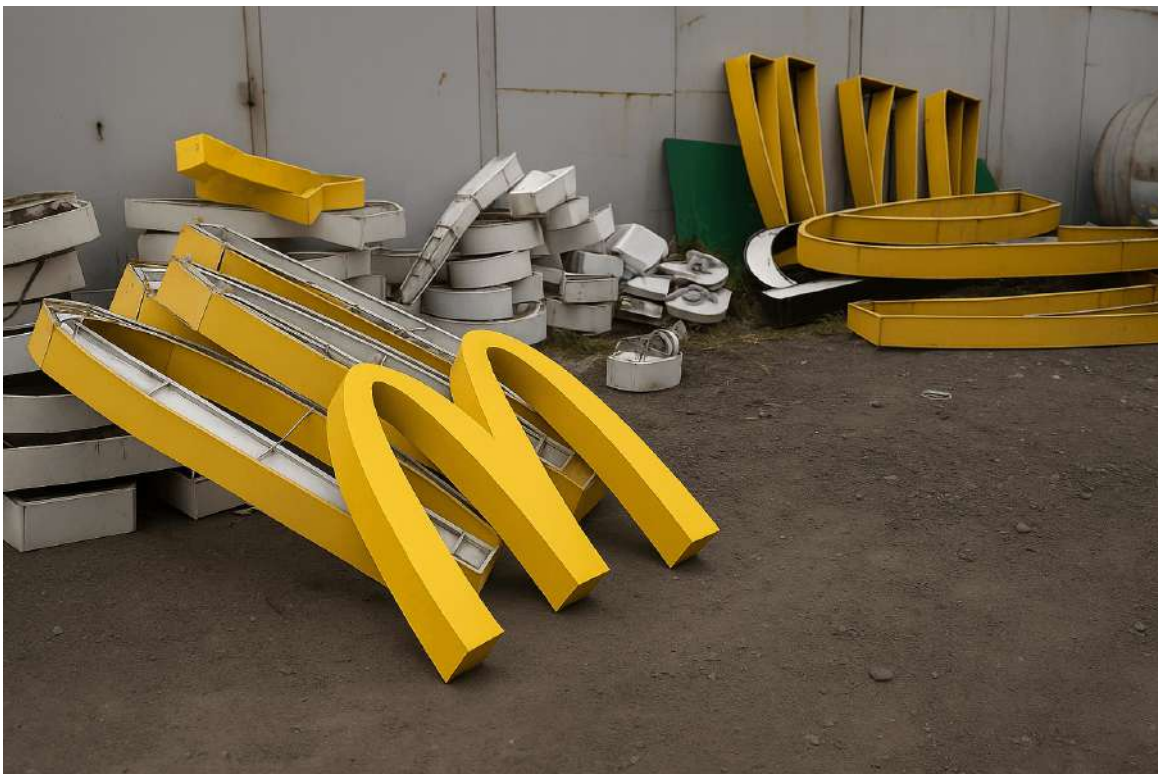
Промзона местного разлива

А тут промзона, прям вот за углом. Си-Люс-Люс смотрит своим славянским прищуром, ну, знаешь, как он смотрит, и говорит: «Идеальное место...» — и пополз в эту подворотню задрипанную. Ну, Пайтон за ним следом, получается. Ну а как иначе? Сухпай сам себя не заточит, чтобы его заточить, надо привал делать, без этого никак.