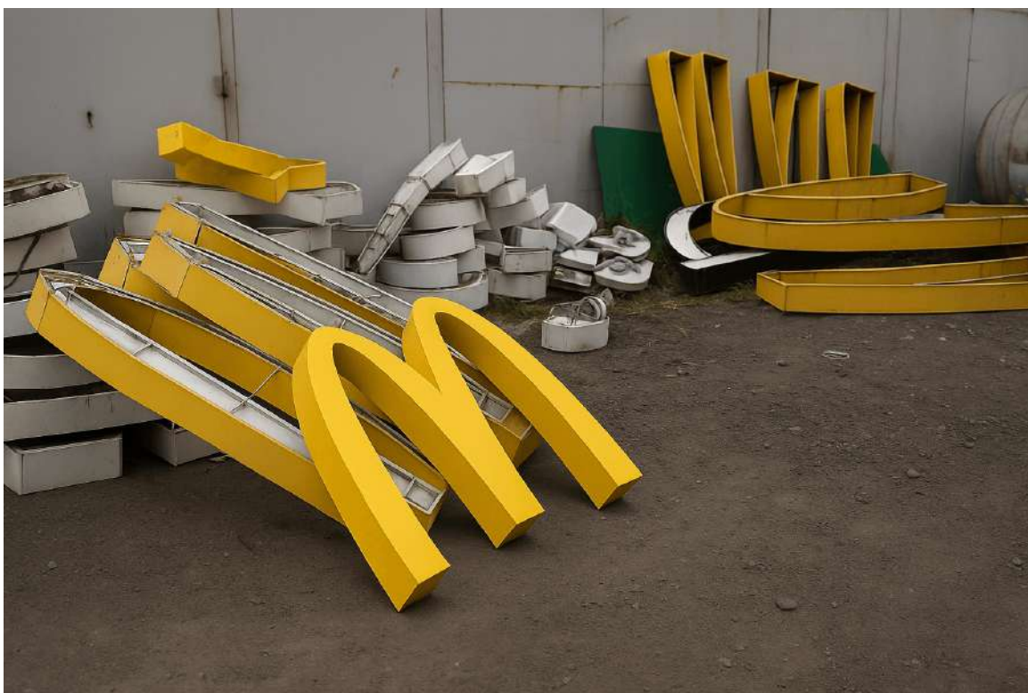
Промзона местного разлива

А тут промзона, прям вот за углом. Си-Люс-Люс смотрит своим славянским прищуром, ну, знаешь, как он смотрит, и говорит: «Идеальное место...» — и пополз в эту подворотню задрипанную. Ну, Пайтон за ним следом, получается. Ну а как иначе? Сухпай сам себя не заточит, чтобы его заточить, надо привал делать, без этого никак.